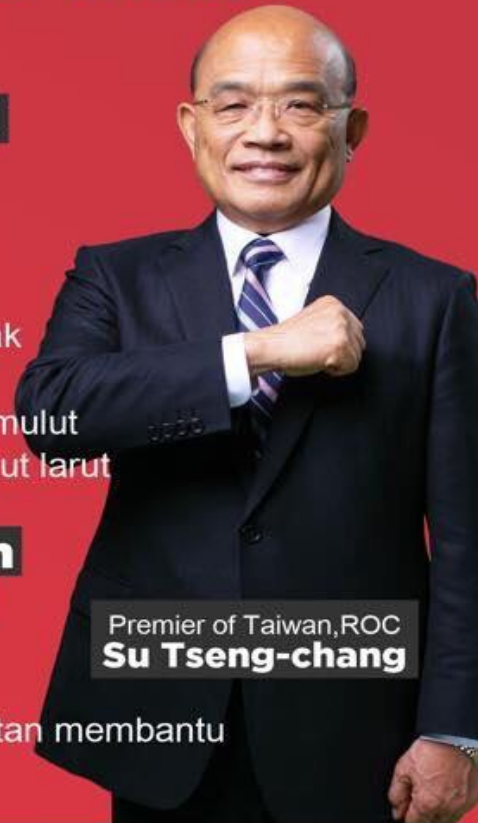
Premier of Taiwan, ROC Su Tseng-chang

waktu balik ke negara asal 14 hari lihat situasi kesehatan dulu telepon hotline ☎1922 Akan ada orang dari dinas kesehatan membantu